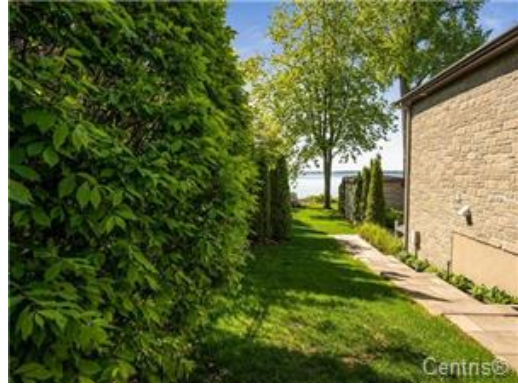
Accès au plan d'eau